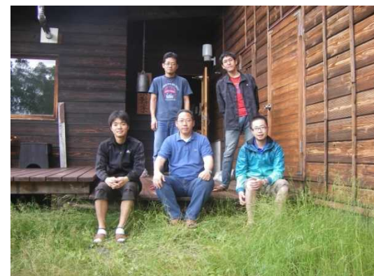
お待ちしております☆