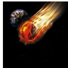
流れ星に願いを込める